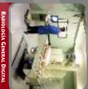
RADIOLOGIA GENERAL DIGITAL