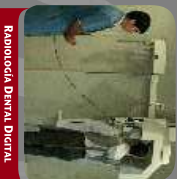
RADIOLOGIA DENTAL DIGITAL

ADemás DEPARTAMENTOS DE : ❖ EPIRIMETRIA ❖ ESPINOGRAFIA ❖ LABORATORIO DE ANALISIS CLINICOS